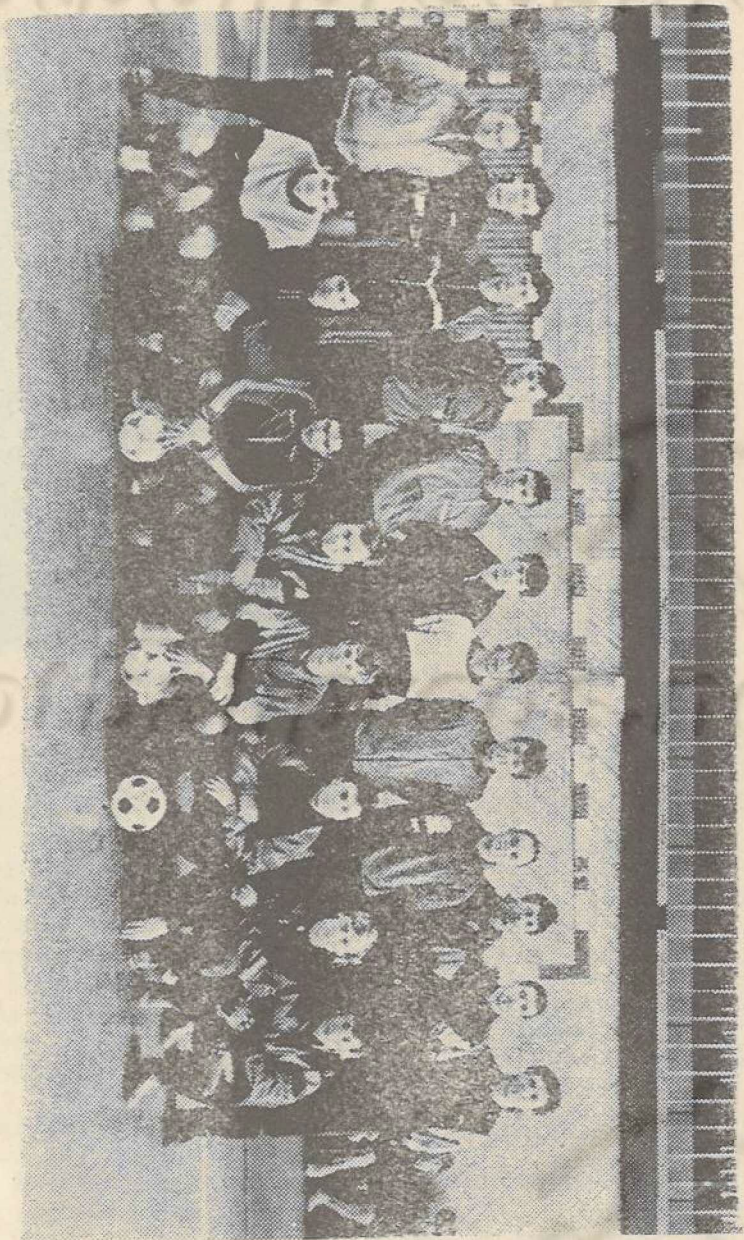
Команда «Ростсельмаш» (Ростов-на-Дону) в 1992 году.