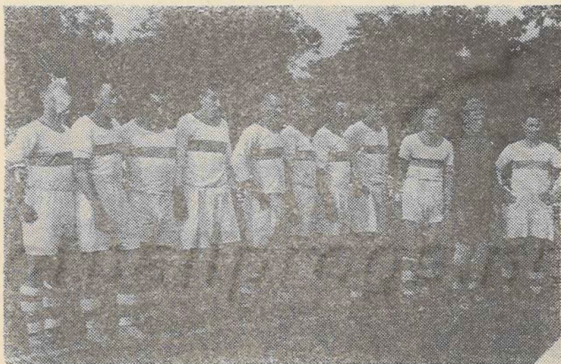
Команда «Динамо» (Ростов-на-Дону) перед встречей с московским «Спартаком».

Сохранился и отчет об этой интересной игре, текст которого мы приводим дословно.