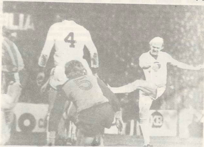
Полузащитник «Андерлехта» Де Грифф.

«Лиловые» к тому дню остались в единственном числе на европейской сцене. Но именно они обвалили начавший было форми-