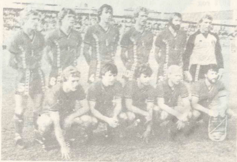
Сборная команда Бельгии.