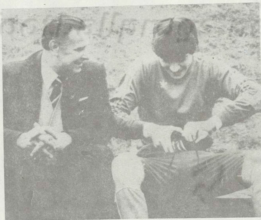
ხურათზე: სახელგანთქმული მეკარე ლევ იაშინი და რინატ დასაევი.