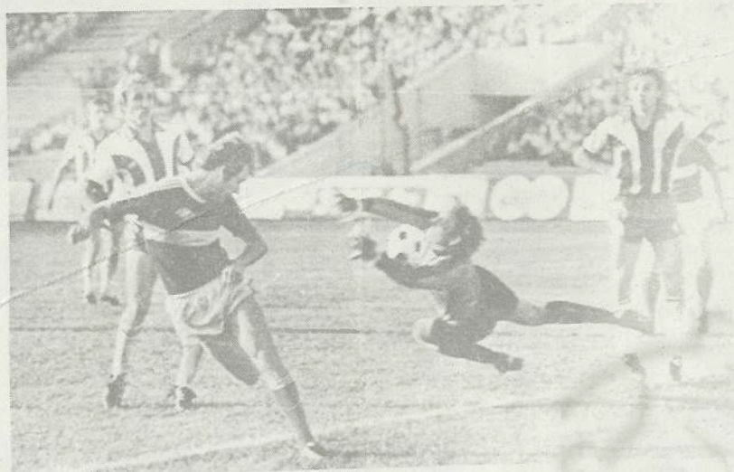
სპარტაკელთა იერიში მეტოქის კართან.