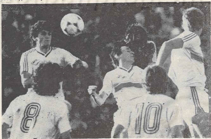
«Спартак»: борьба на всех этажах.

Лучшими футболистами страны признавались: Е. Ловчев (1972 г.), Р. Дасаев (1982 г.), Ф. Черенков (1988, 1989 гг.).