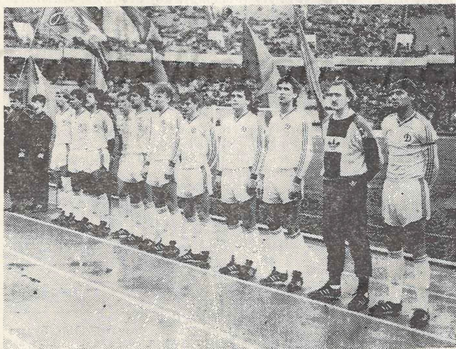
«Динамо»: пока еще в сильнейшем составе.

Приз лучшего футболиста Европы «Золотой мяч» получили О. Блохин (1975 г.), И. Беланов (1986 г.).