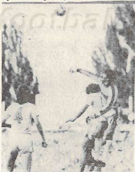
Уверенно играет вратарь «Спартак» Станислав Черчесов.

Как видно, динамовцы, проиграв три последние матча на своем поле, сейчас в долгу перед своими болельщиками. Надежды на «домашний» реванш придает и уверенная победа, одержанная нашими земляками в Москве в матче первого круга. Приводим краткую стенограмму матча: