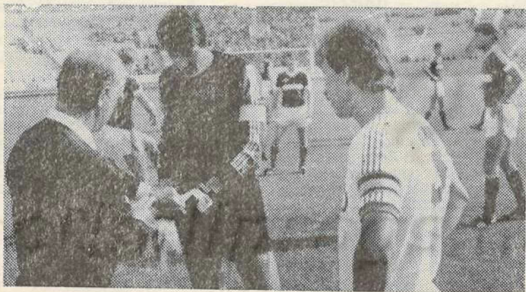
Перед игрой. В центре — Ринат Дасаев.

Долгие годы, играющий почти без замен, практически не знающий отпусков и выходных, Дасаев для многих молодых игроков стал образцом спортсмена, ставящего перед собой высокие цели и без страха идущего к ним. «В 1990 году надеюсь еще сыграть на очередном чемпионате мира и вместе с командой занять первое место», — мечтает он. Что ж, итальянцу Зоффу это удалось.