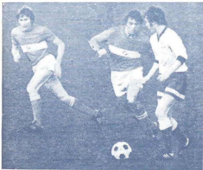
1975 г. «Спартак» — «Динамо». Эпизод из матча.