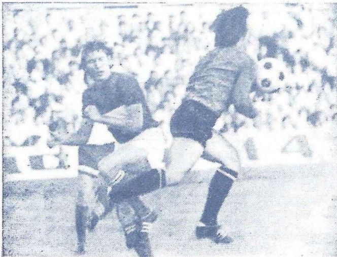
1974 г. «Динамо» — «Спартак».

Сегодня на нашем стадионе первый матч второго круга чемпионата страны. Правда, одна из играющих команд — «Спартак» приняла старт во второй половине чемпионата четыре дня назад, сыграв в Лужниках с «Локомотивом». Однако у «Спартака», как и у его сегодняшнего соперника, 15 игр, поскольку его встреча первого круга с киевским «Динамо» отложена на более поздний срок.