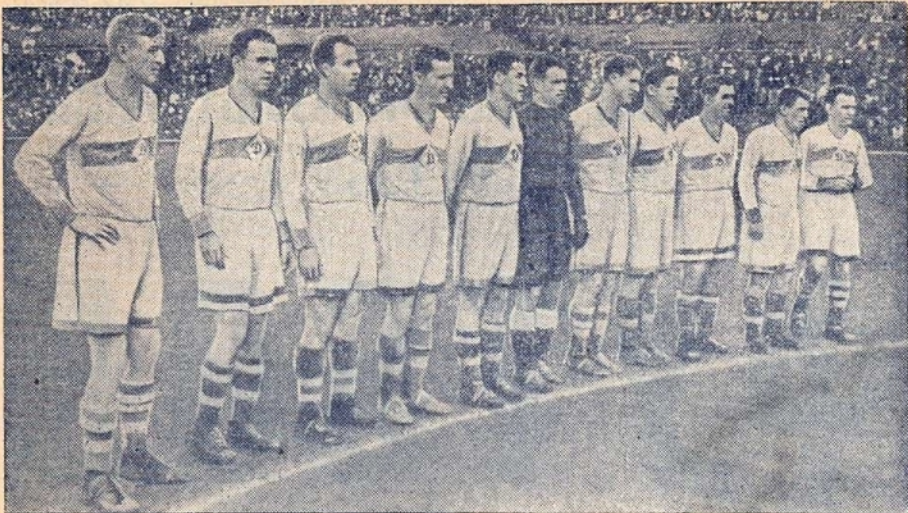
Московское «ДИНАМО» — чемпион Союза и победитель кубка 1937 года.