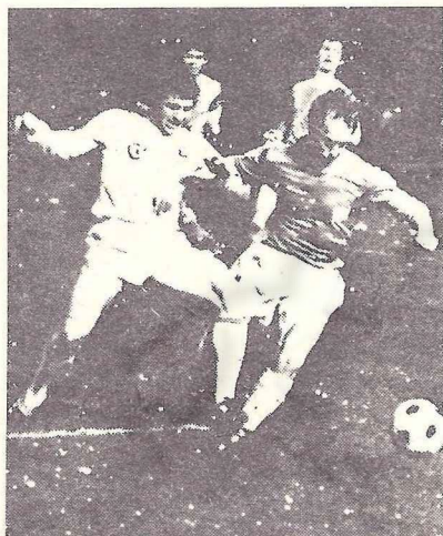
Из истории встреч «Динамо» (Тб) — «Спартак» (М).