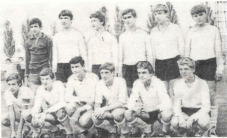
Команда СШ № 13 г. Днепропетровска — чемпион страны на приз клуба «Кожаный мяч».