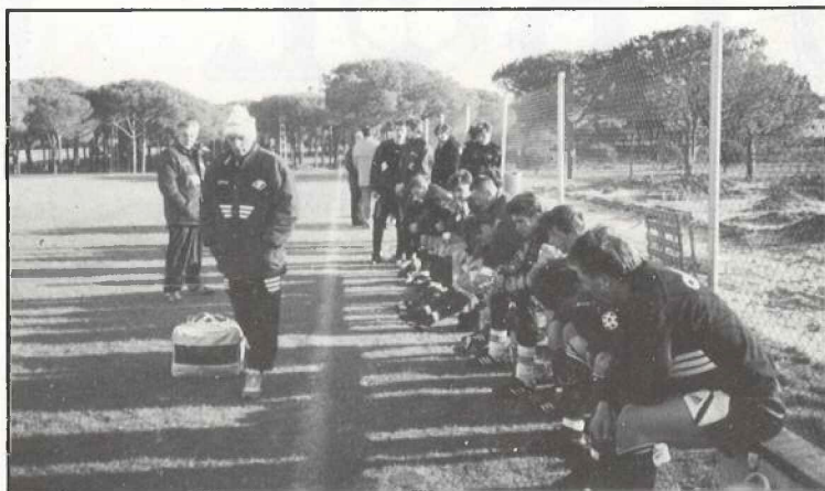
El Spartak, durante un entrenamiento en Chiclana de la Frontera