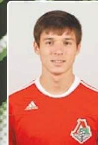
[96] Дмитрий ПОЛОЗ Нападающий Россия Дата рождения: 12.07.1991 Рост, вес: 183 см, 73 кг