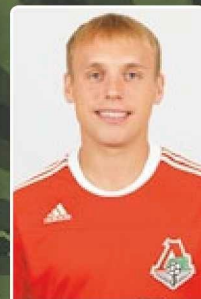
[8] Денис ГЛУШАКОВ Полузащитник Россия Дата рождения: 27.01.1987 Рост, вес: 178 см, 72 кг