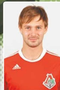
[11] Дмитрий СЫЧЕВ Нападающий Россия Дата рождения: 26.10.1983 Рост, вес: 176 см, 73 кг