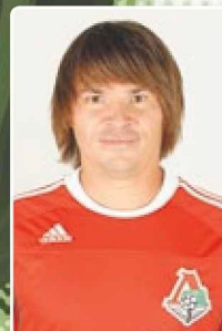
[10] Дмитрий ЛОСЬКОВ Полузащитник Россия Дата рождения: 12.02.1974 Рост, вес: 178 см, 75 кг