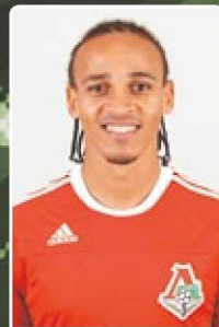
[9] Питер ОДЕМВИНГИЕ Нападающий Россия Дата рождения: 15.07.1981 Рост, вес: 182 см, 74 кг