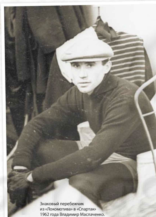
Знаковый перебежчик из «Локомотива» в «Спартак» 1962 года Владимир Маслаченко.