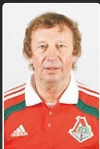
Юрий СЕМИН Главный тренер Россия Дата рождения: 11.05.1947