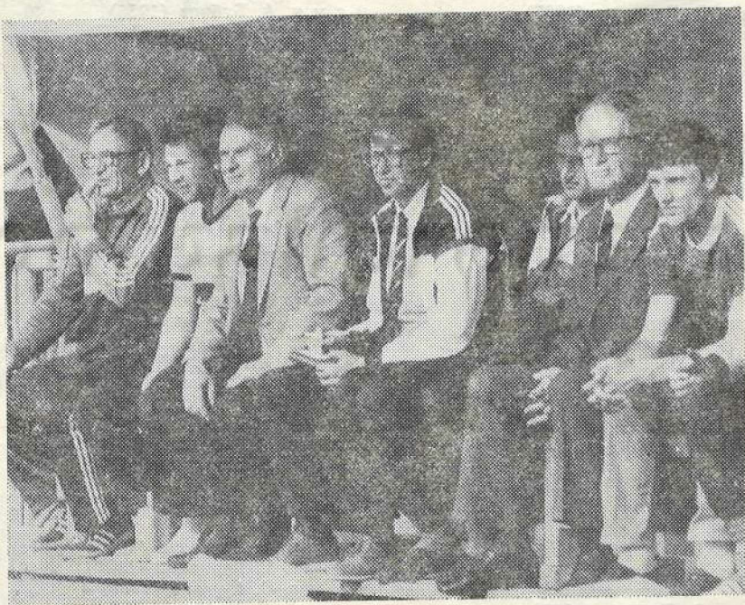
На «капитанском мостике» главный тренер «Спартака» К. И. Бесков (третий слева) и начальник команды Н. П. Старостин (второй справа).

Как обычно, подготовительный период «Спартак» проводил дома, дополняя занятия товарищескими играми. Только за первый месяц команда провела