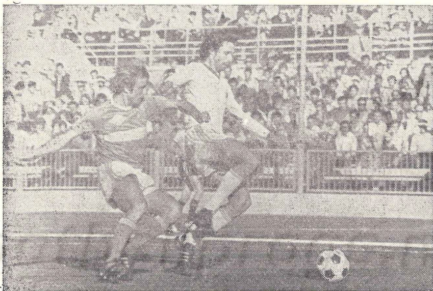
Эпизод из прошлогоднего матча ЦСКА — «Спартак».