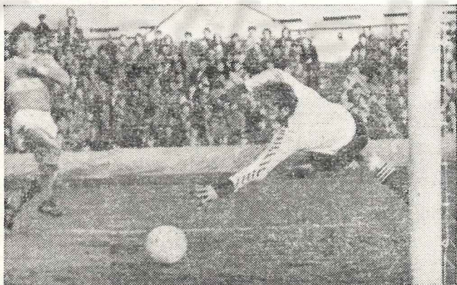
1976 г. ЦСКА — «Спартак». Второй гол в ворота армейцев.

— У нас в команде хорошее боевое настроение. Турнир в Барселоне заставил нас поверить в свои силы, и мы рассчитываем выступить в осеннем чемпионате значительно лучше, чем в предыдущем. Сразу оговорюсь — по первому матчу нового чемпионата с «Зенитом» не следует делать выводов о нашей игре. Мы прибыли в Москву из Испании накануне матча с ленинградцами, устали как от самого турнира, так и от переездов и перелетов и не успели восстановить силы.