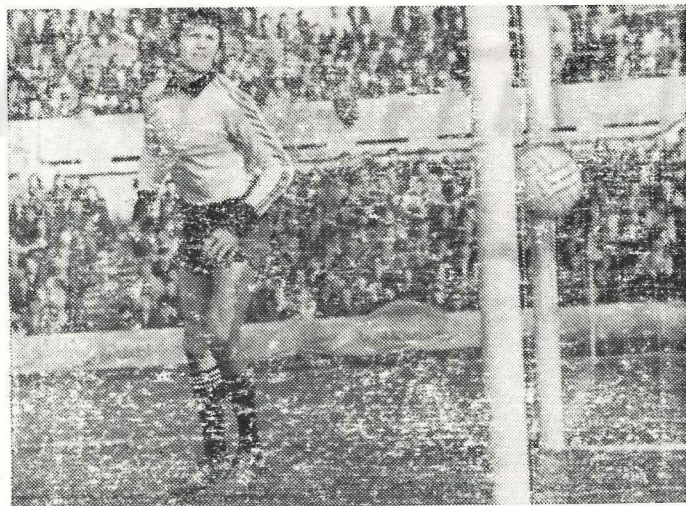
1976 г. ЦСКА — «Спартак». Первый гол в ворота армейцев.